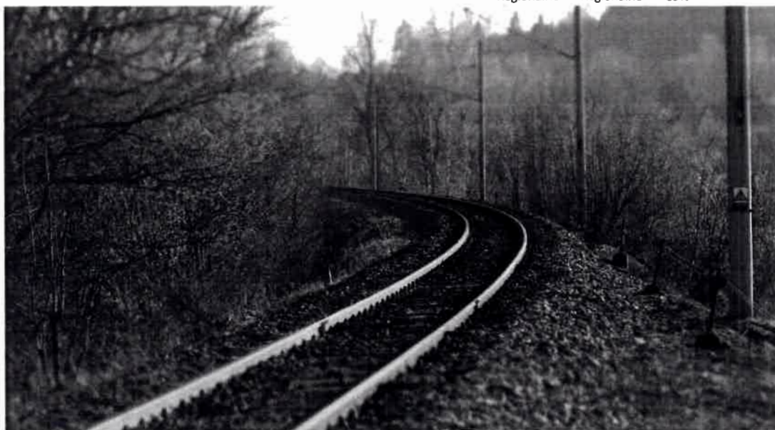
Regionalne- Regionalne- C5%